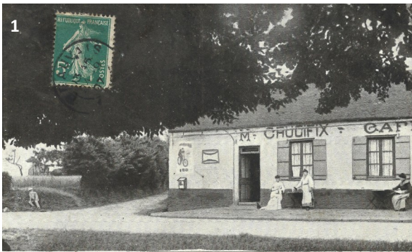
Rome près Beauvais. - Le Café-Restaurant