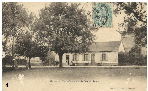
281 - Au Casse-Croûte des Ruines de Rome.