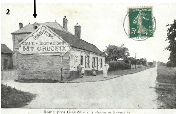
Rome près Beauvais. - LA ROUTE DE SAVIGNIES